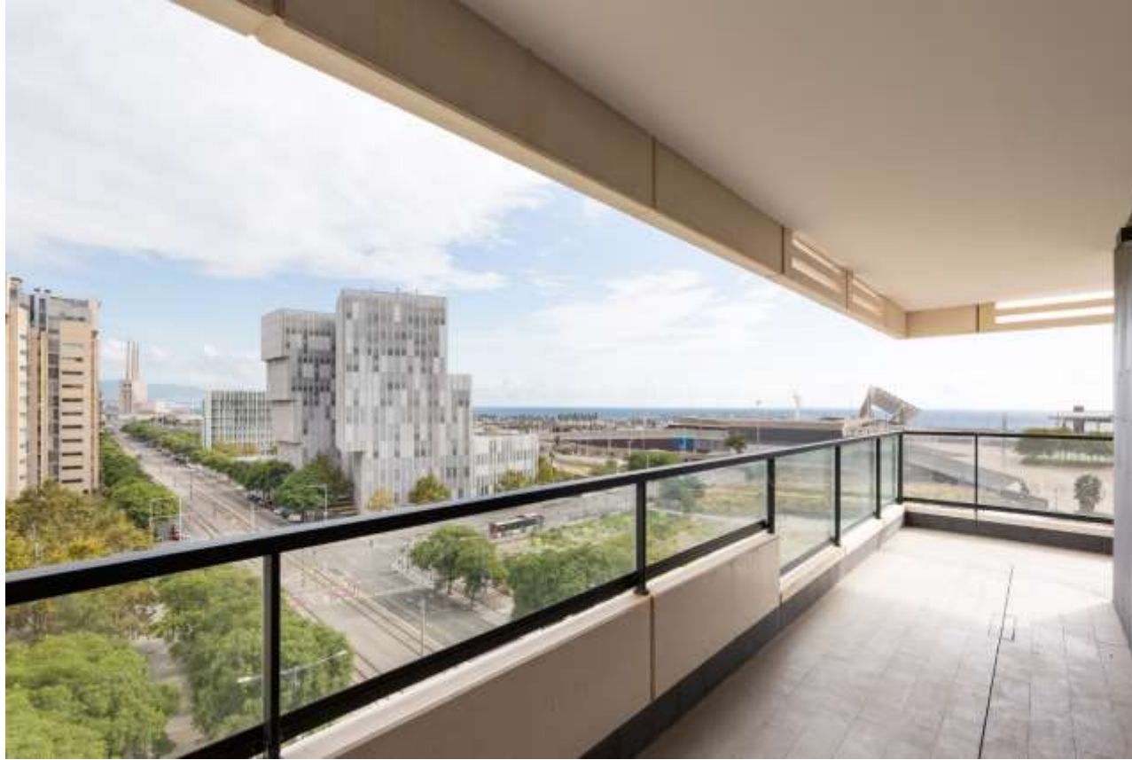
Piso en Diagonal Mar i el Front Marítim del Poblenou