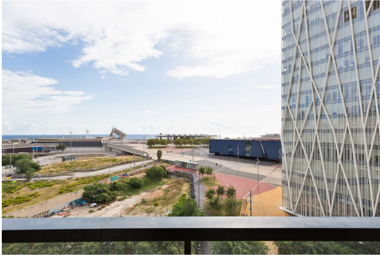
Piso en Diagonal Mar i el Front Marítim del Poblenou